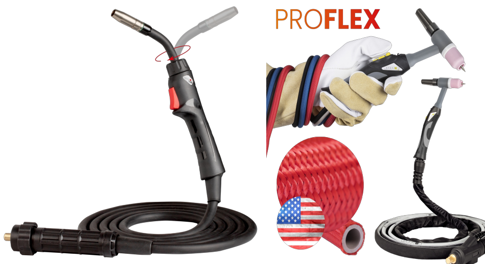
Uchwyt SPARTUS® 150R z obrotową główką palnika

Na indywidualne zamówienie możliwe jest również komponowanie poszerzonego zestawu o wcześniej wspomniany uchwyt ProTIG SPP17 z niezbędnikiem części palnika. Jest to wysokiej klasy polski uchwyt spawalniczy wykonany na amerykańskich przewodach ProFlex, które zachowują wysoki poziom elastyczności zarówno w wysokiej jak i niskiej temperaturze.