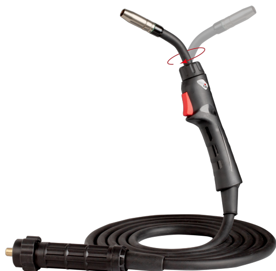
Uchwyt SPARTUS® 150R z obrotową główką palnika

Na indywidualne zamówienie możliwe jest również komponowanie poszerzonego zestawu o wcześniej wspomniany uchwyt ProTIG SPP17 z niezbędnikiem części palnika. Jest to wysokiej klasy polski uchwyt spawalniczy wykonany na amerykańskich przewodach ProFlex, które zachowują wysoki poziom elastyczności zarówno w wysokiej jak i niskiej temperaturze.