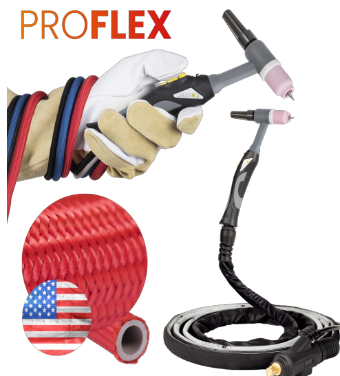
Uchwyt SPARTUS® Pro 17 1B X

Ponadto do zaprezentowanych konfiguracji dodatkowo polecamy kompatybilne uchwyty Spool Gun, reduktory gazu, sterowanie nożne oraz inne akcesoria marki SPARTUS®.