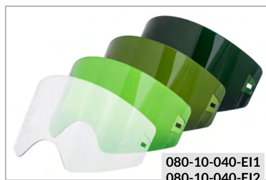
080-10-040-EI1 080-10-040-EI2 080-10-040-EI3 080-10-040-EI5