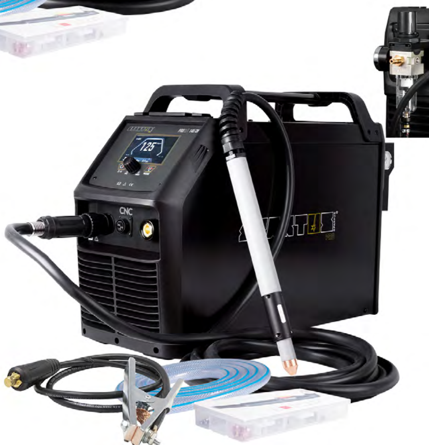
Pakiet z uchwytem SPARTUS® 125MY 7.5m