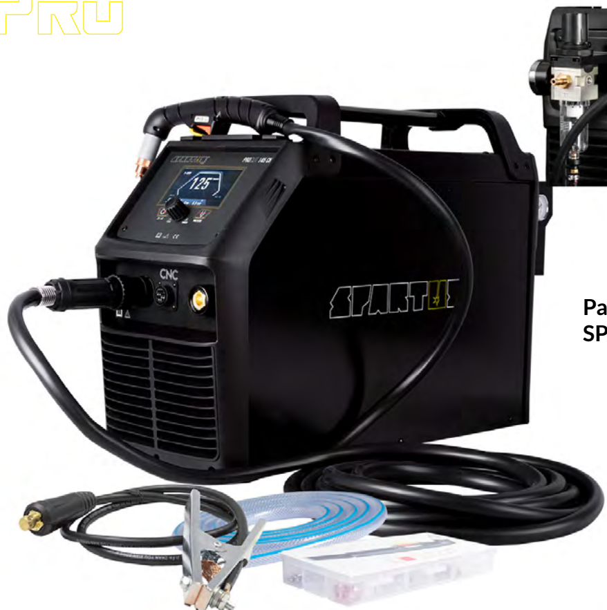
Pakiet z uchwytem SPARTUS® 125HY 7.5m